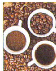
Tazas de café.

La artritis reumatoide es una enfermedad grave y crónica que en España afecta a más de 250.000 personas, en su mayoría mujeres. ■